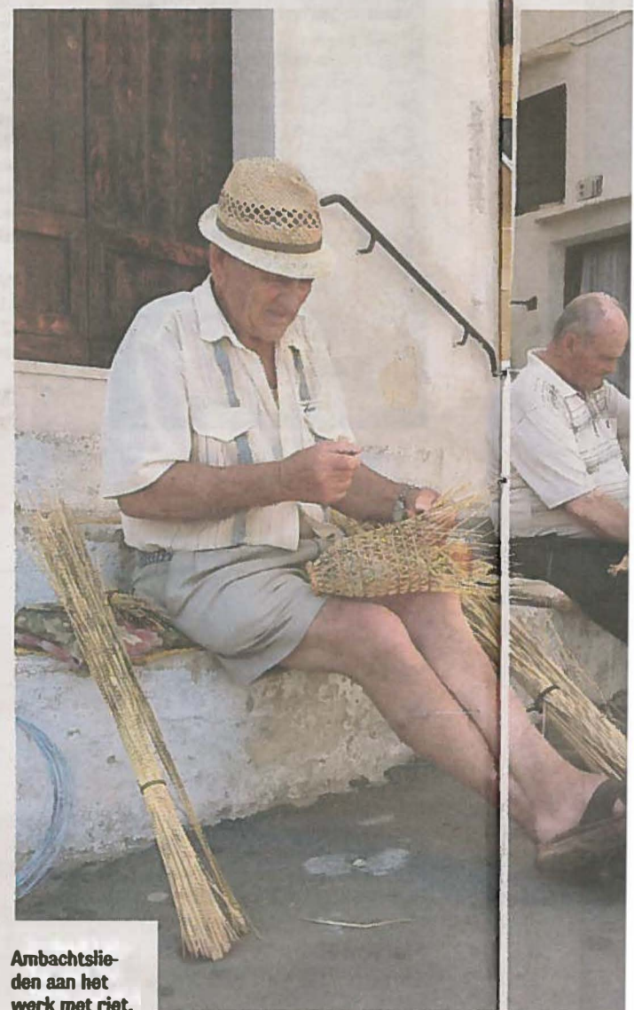
Ambachtslieden aan het werk met riet.

Goed je neus in het glas duwen, maar niet te lang