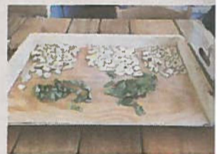
In Pezze di Greco kunnen pasta workshops worden gevolgd.

Polignano a Mare, aan de Adriatische kust is zeker een bezoek waard.