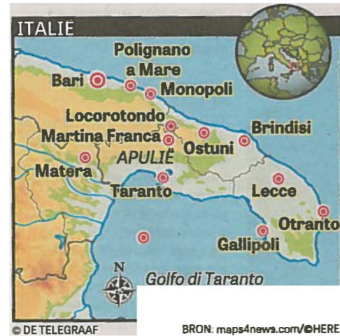
De kustplaats Monopoli vormt samen met Ostuni, Locorotondo, Martina Franca en Polignano a Mare de charmante Valle d'Itria.