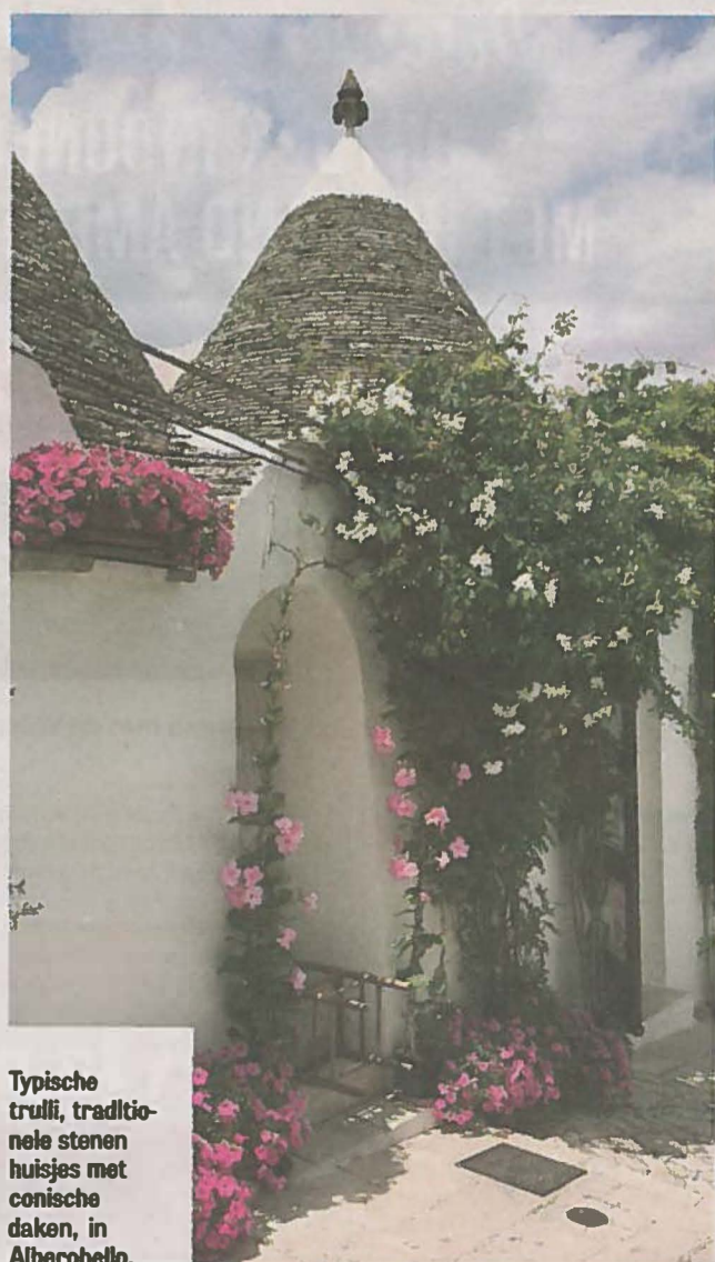
Typische trulli, traditionele stenen huisjes met conische daken, in Alberobello.