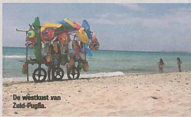
De westkust van Zuid-Puglia.

Extra reglokorting tot wel €50 p.p. bij vertrek vanaf Eindhoven, Maastricht, Rotterdam of Groningen