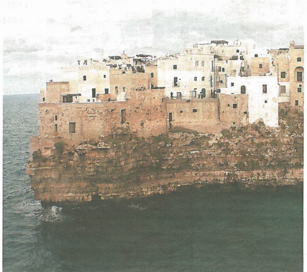
Het stadje Pulignano lijkt te zijn gebouwd uit 'n kliffen.

In Puglia komt de temperatuur eigenlijk nooit onder nul. In de winter is het er vaak nog 8 à 9 graden. In de zomermaanden juli en augustus kan het er wel erg heet zijn: dagen boven de 30 graden komen geregeld voor. De beste periode om de streek te bezoeken is het voorjaar, en dan wel de maanden april, mei en juni en in het najaar, de maanden september en oktober.