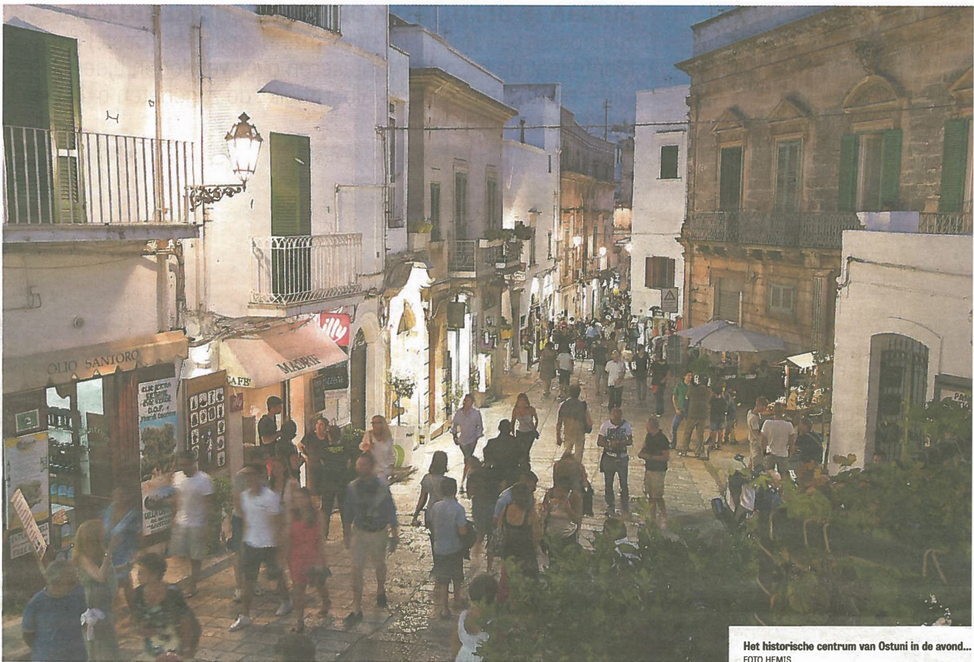
Het historische centrum van Ostuni in de avond...