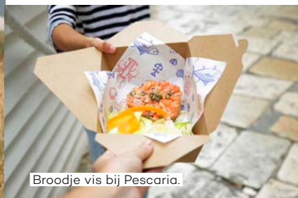
Broodje vis bij Pescaria.

Ongerepte natuur en nauwelijks toeristen vind je dan weer bij Torre Guaceto in Brindisi. Dat is een natuurreservaat, dus zijn er geen strandtenten. Wat je er wel krijgt: pure stilte. Punta Prosciutto in Gallipoli bewijst dat je voor tropische taferelen niet naar de Caraïben hoeft af te reizen.