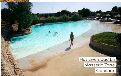
Het zwembad bij Masseria Torre Cocco.

Bij I Cinque Fiori in Rutigliano en in Adelfia vind je Céline, Acne, Loewe, J.W. Anderson en lokale designers. Leuk extraatje: elk seizoen wordt het interieur aan de collectie aangepast. Bij Quadra Group in Trani vind je luxe merken, maar ook high street parels. En hou je van bijzondere markten? Een aanrader is de antiekmarkt in Martina Franca op woensdagochtend. ■