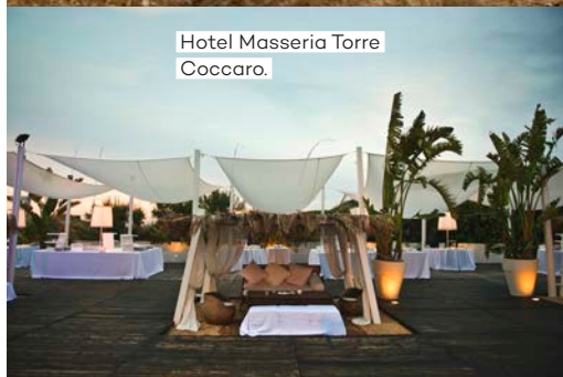
Hotel Masseria Torre Coccaro.