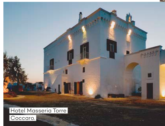
Hotel Masseria Torre Coccaro.

afstand van het hotel. Het mooie is: je mag tijdens je verblijf gratis gebruikmaken van de fietsen en dus koers je door prachtige lavendelvelden zo naar de zee. Genoeg plekken om urenlang van de zon te genieten. Sla vooral Coccaro Beach Club niet over, waar je de lekkerste verse vis kunt bestellen.